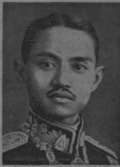
H. M. K. PRAJADHIPOK Rey de Siam

Era el reinado de Siam uno de los más típicos de Oriente donde podían verse las más arcaicas costumbres asiáticas. Su dinastía era absoluta y milenaria. Pero las teorías occidentales han prevalecido y Siam ha visto producirse recientemente revoluciones sangrientas en pro de la democracia. Y hoy día Prajadhipok es un rey cuyas funciones son limitadas por una Carta Constitucional y el pueblo tiene su representación en un Parlamento.